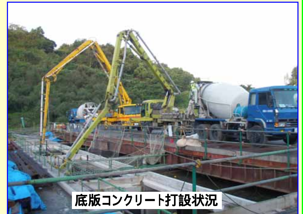
底版コンクリート打設状況