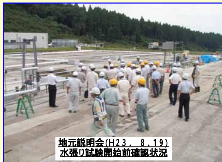
地元説明会(H23. 8.19) 水張り試験開始前確認状況