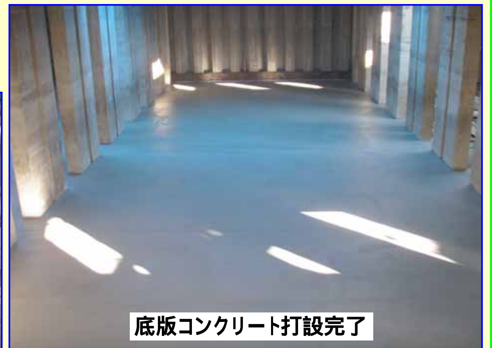
底版コンクリート打設完了