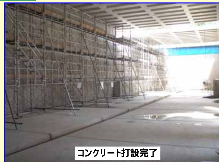
コンクリート打設完了