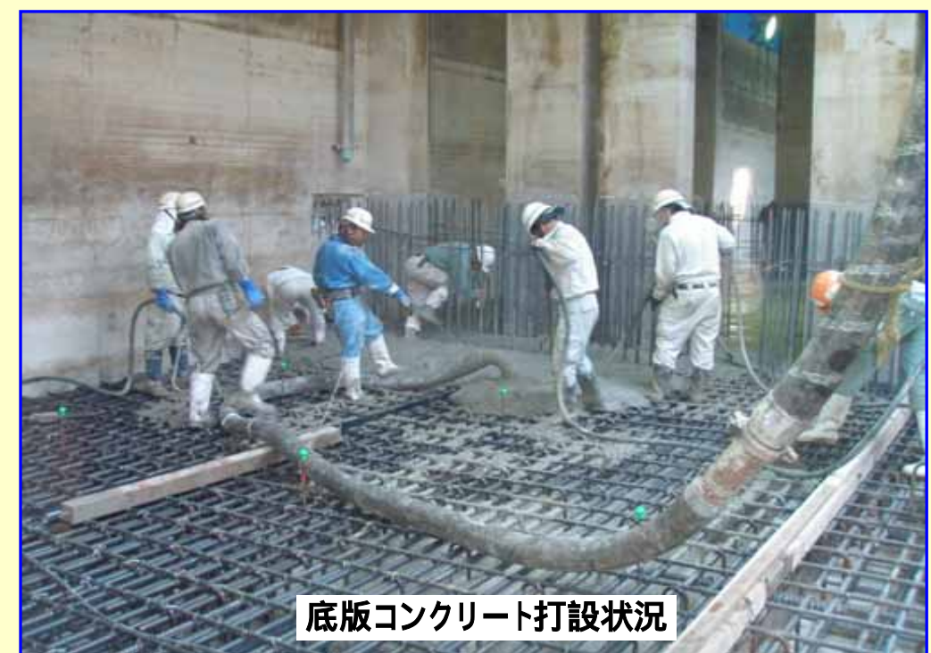
底版コンクリート打設状況