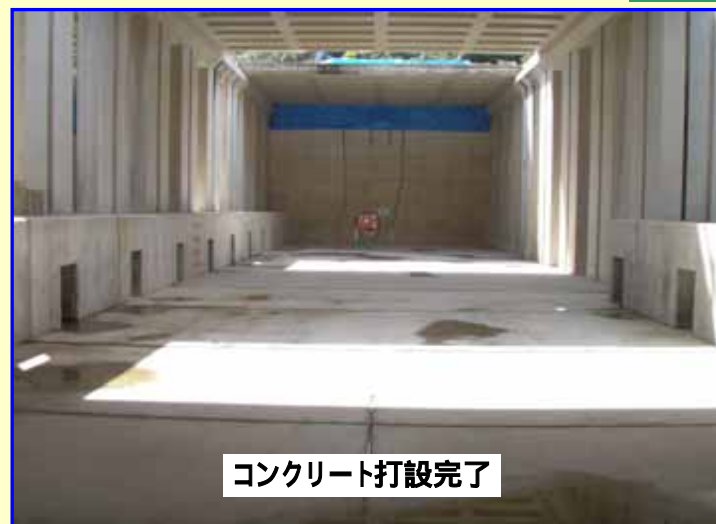
コンクリート打設完了