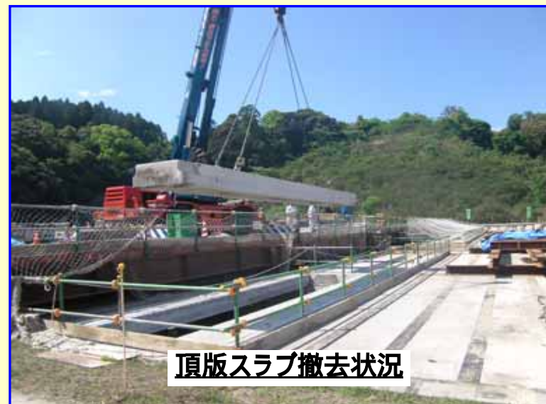
頂版スラブ撤去状況