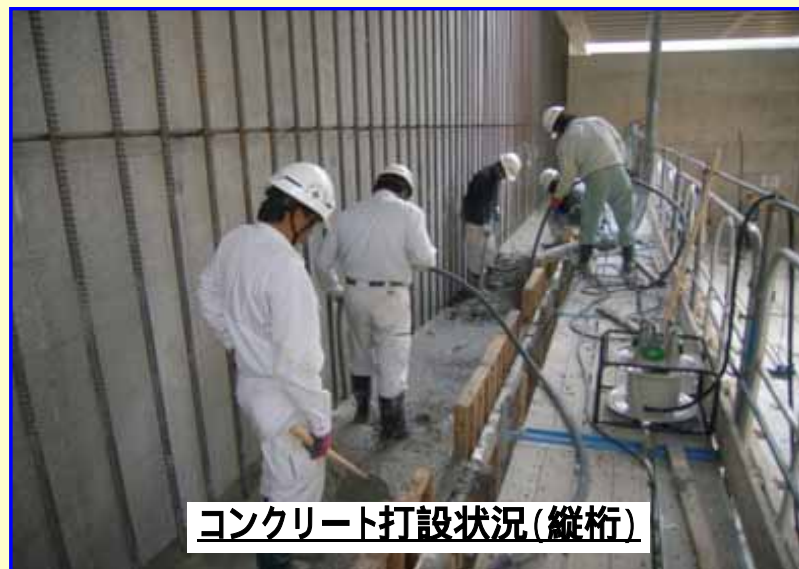
コンクリート打設状況(縦桁)