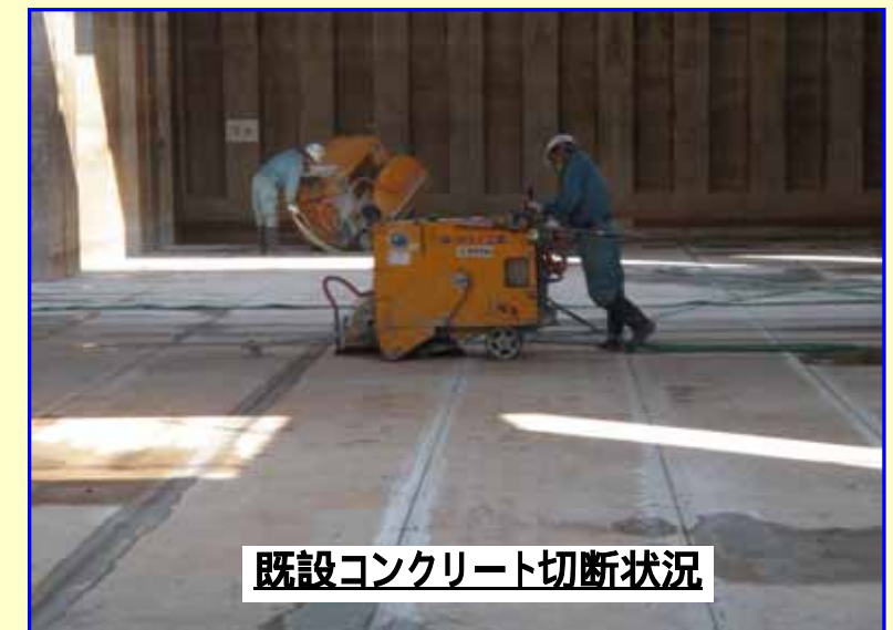
既設コンクリート切断状況