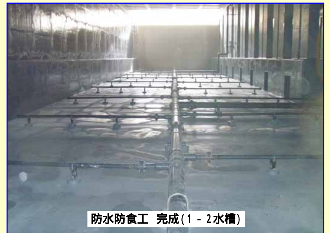
防水防食工 完成(1-2水槽)