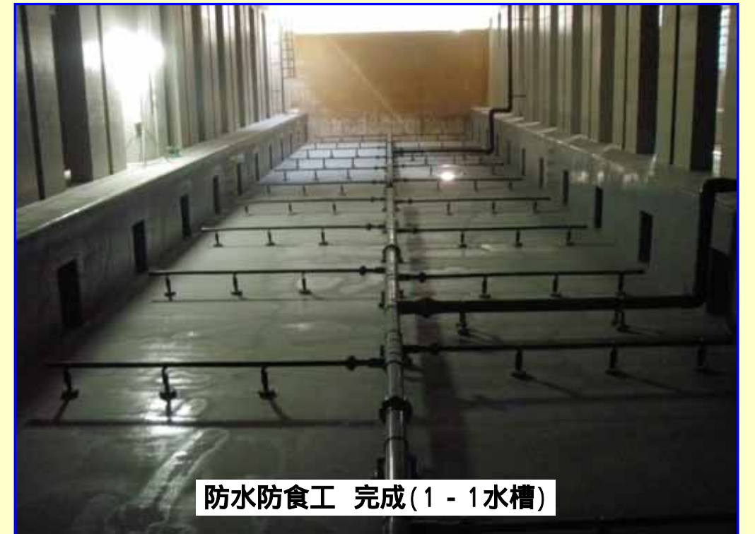
防水防食工 完成(1-1水槽)