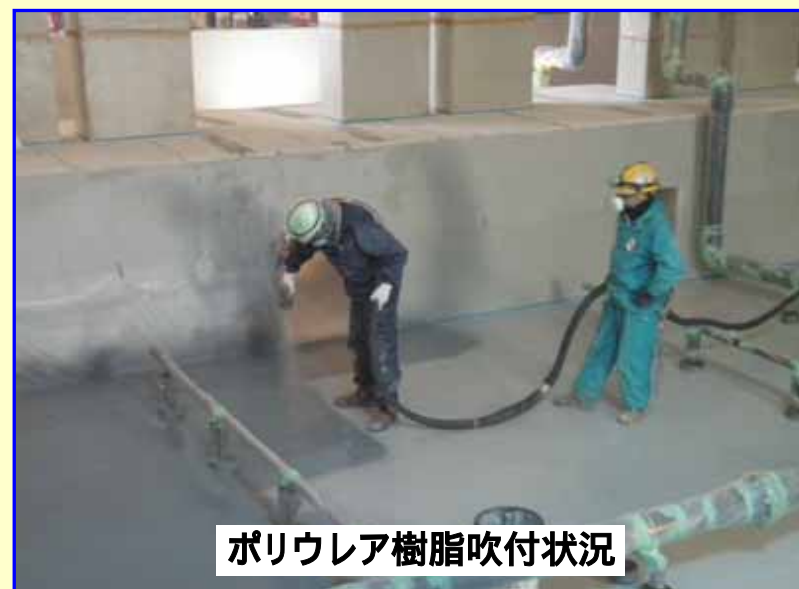
ポリウレタ樹脂吹付状況