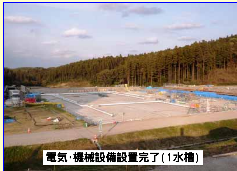
電気・機械設備設置完了(1水槽)