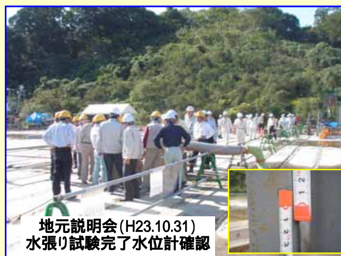
地元説明会(H23.10.31) 水張り試験完了水位計確認