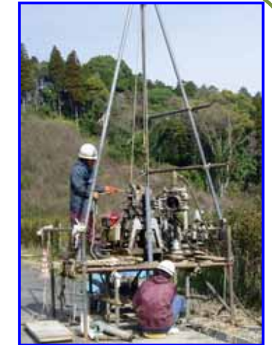
調査ボーリング 地下埋設物を調査 しています。