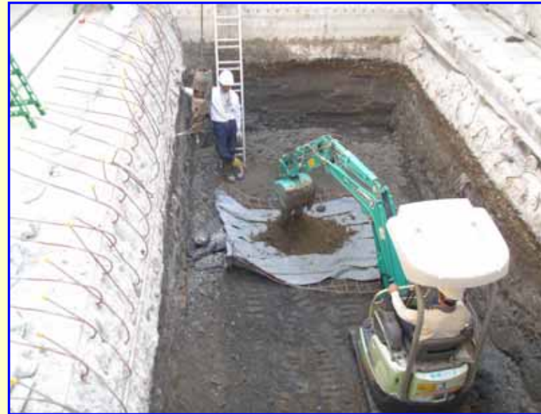
地中梁(幅3.0m・高さ1.93m)を設置するための掘削を行っています。掘削完了後は、底面から基礎杭を施工します。