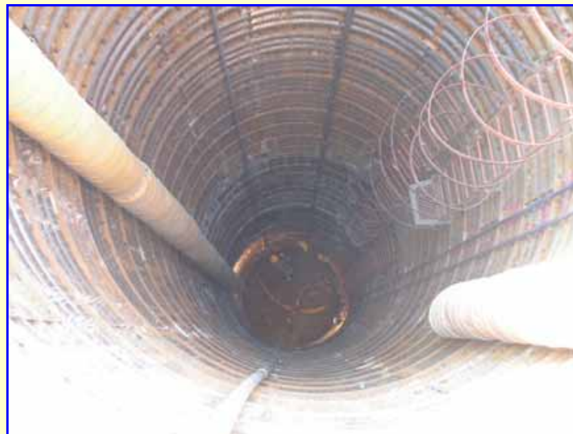
立孔内部 直径3.0m 掘削深さ18.5m(8/27現在) 暗渠管損傷箇所の、目視確認は、9月上旬の予定です。