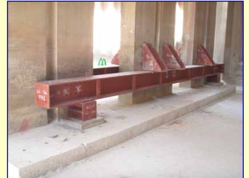
地中梁掘削の際、部分的にプレキャストブロックの下を掘削するため、影響が生じないように鋼材で支えています。