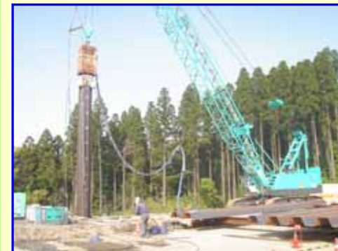
鋼矢板打ち込み状況