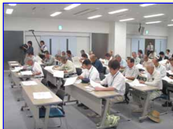
工事概要説明状況