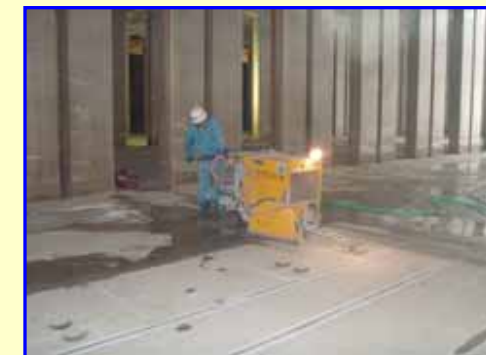
カッター切断状況