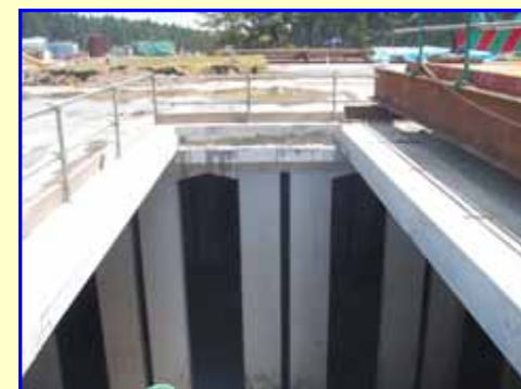
水槽上部、蓋撤去完了