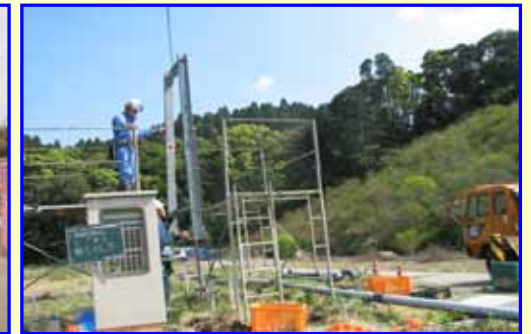
水槽上部の配管撤去状況