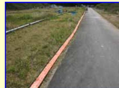
水槽上部の電気配線を外側に移設しました。