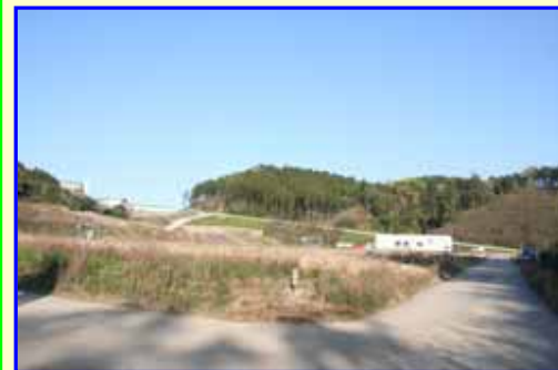
水槽上部の土砂撤去前