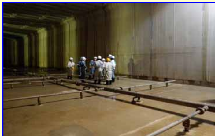
日時：平成21年4月6日 14:00 宮崎県の環境森林部長・次長等の視察がありました。