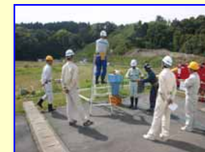
浸出水送水管の水圧試験。