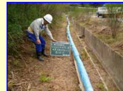
水槽上部の浸出水送水管を外側に移設しました。