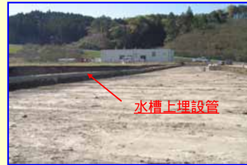
東側土砂撤去完了