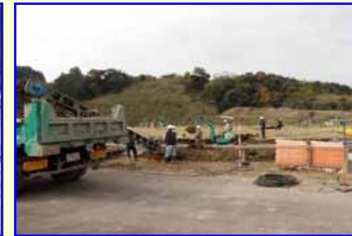
水槽上部の土を小型バックホウ・ベルトコンパアにて撤去しています。