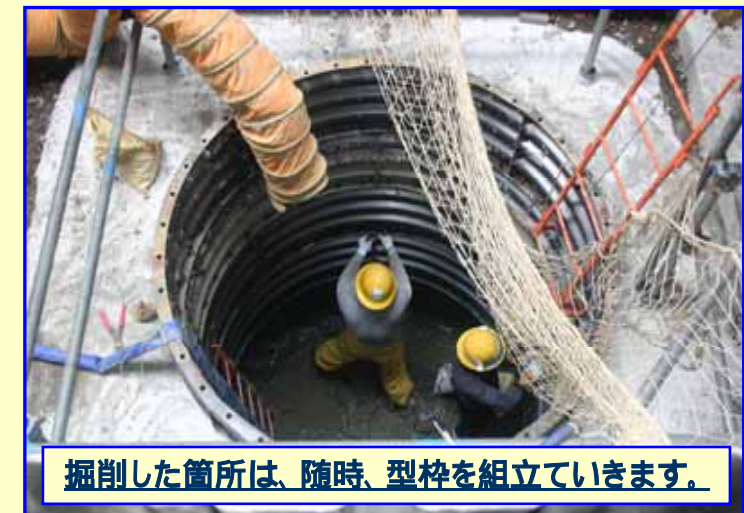
掘削した箇所は、随時、型枠を組立ていきます。