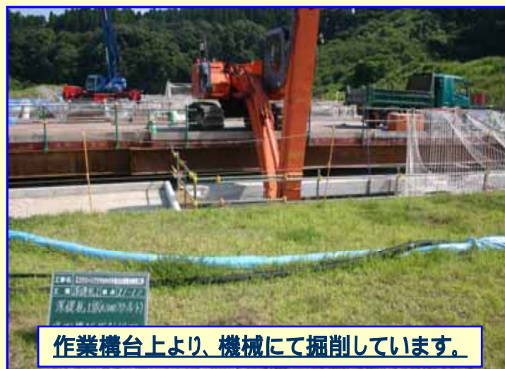
作業構台上より、機械にて掘削しています。