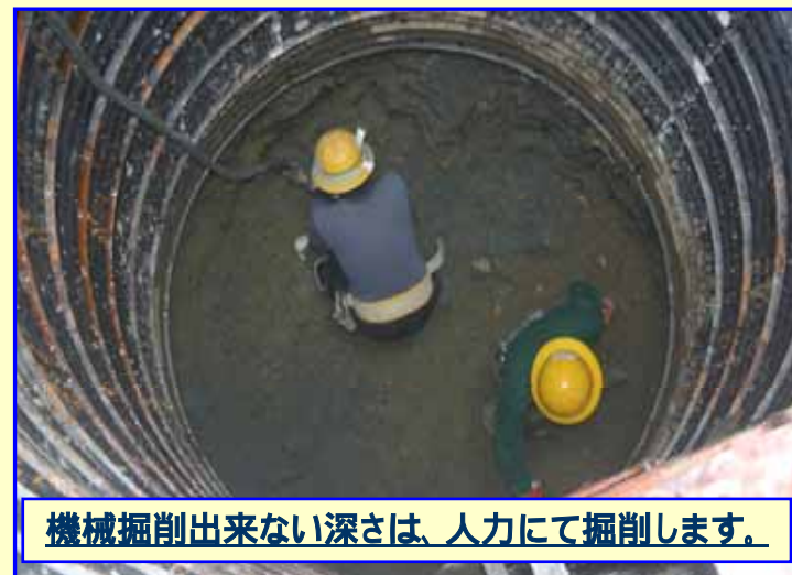
機械掘削出来ない深さは、人力にて掘削します。