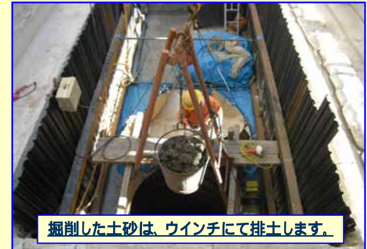
掘削した土砂は、ウインチにて排土します。