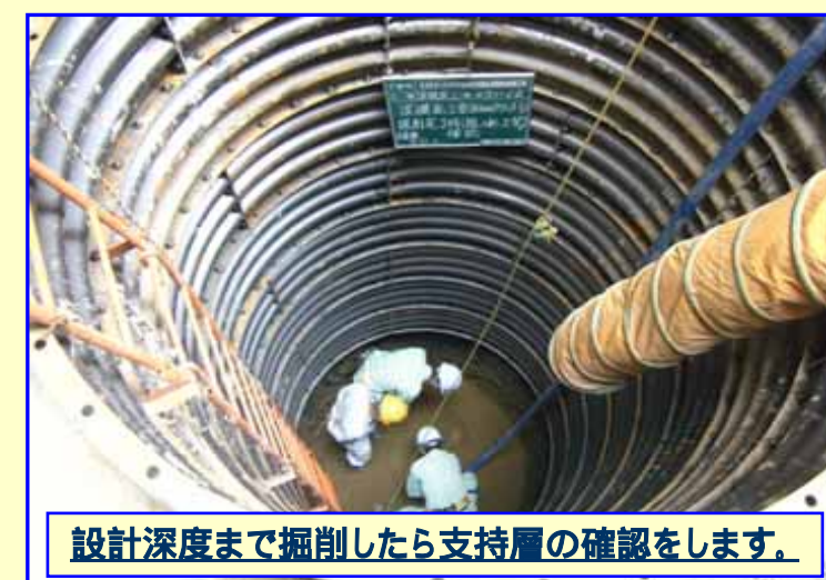
設計深度まで掘削したら支持層の確認をします。