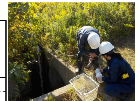
浸出水調整池地下水