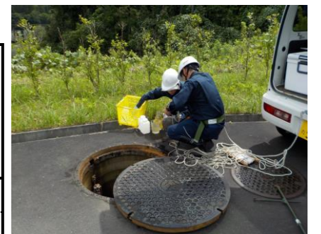
浸出水調整池地下水