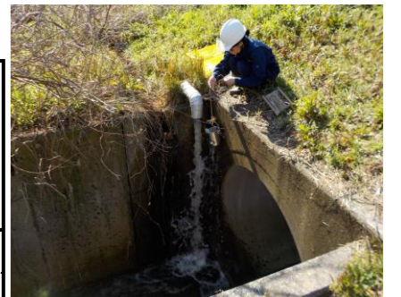
浸出水調整池地下水