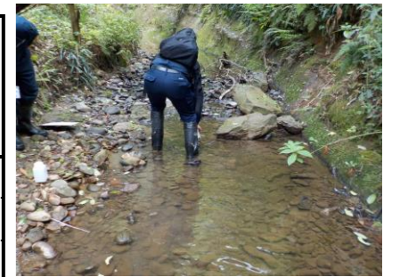
防災調整池排水（敷地境界）