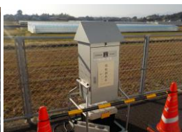
③営農研修センター