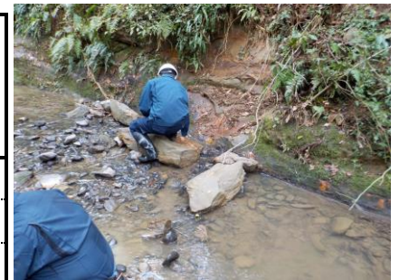
防災調整池排水（敷地境界）