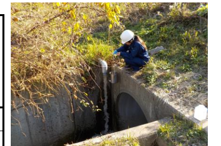
浸出水調整池地下水