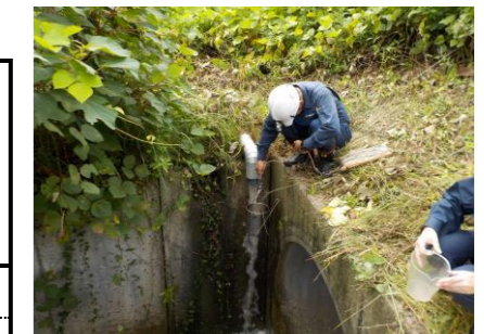
浸出水調整池地下水