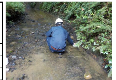
防災調整池排水（敷地境界）