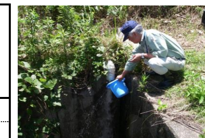
浸出水調整池地下水