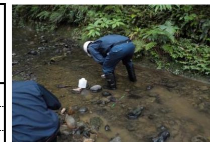
防災調整池排水（敷地境界）