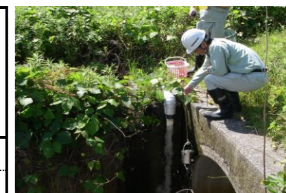
浸出水調整池地下水