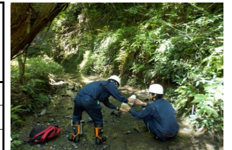
防災調整池排水（敷地境界）