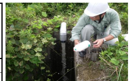
浸出水調整池地下水