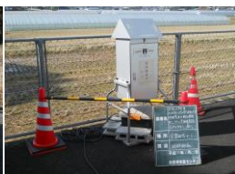
③営農研修センター