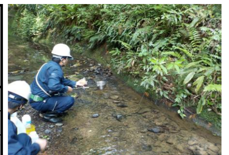
防災調整池排水（敷地境界）