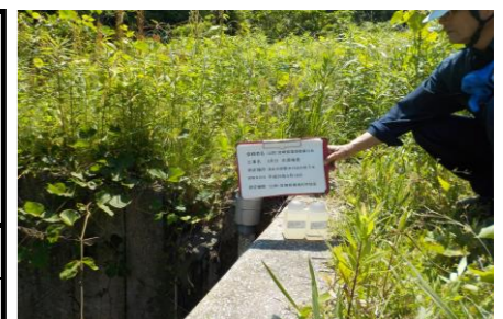
浸出水調整池地下水