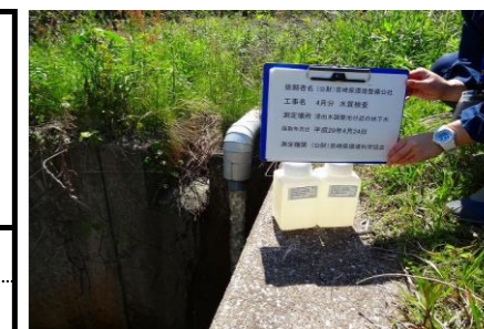
浸出水調整池地下水