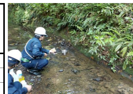
防災調整池排水（敷地境界）