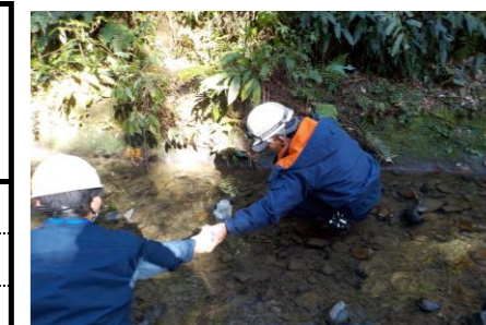
防災調整池排水（敷地境界）