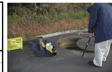
浸出水調整池地下水