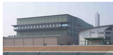
焼 却 施 設

4月の調査は、01から05の検査項目を実施しました。調査の結果、全ての検査項目で評価基準値を満足していました。