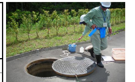
浸出水調整池地下水