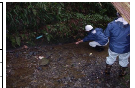
防災調整池排水（敷地境界）