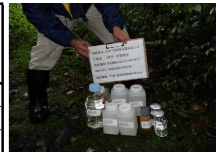
防災調整池排水（敷地境界）