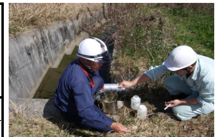
浸出水調整池地下水