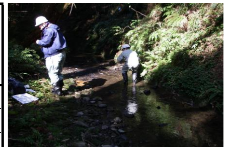
防災調整池排水（敷地境界）