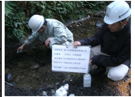
防災調整池排水（敷地境界）