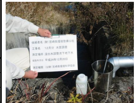
浸出水調整池地下水