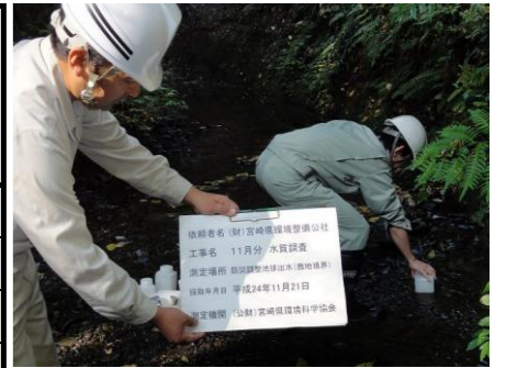
防災調整池排水(敷地境界)