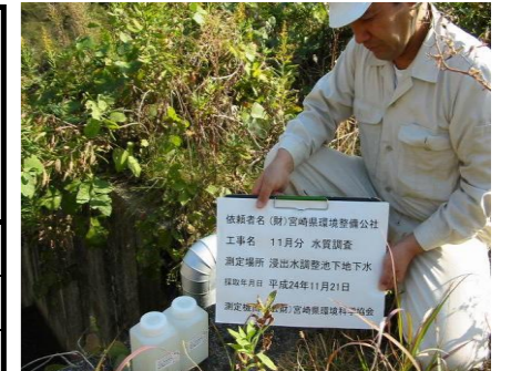
浸出水調整池地下水