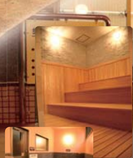
檜風呂風浴場内サウナ 隣接水風呂

芝生の上を駆けたりと、 のびのびと体を動かせるスペースです。 グランドゴルフ等に適しています。