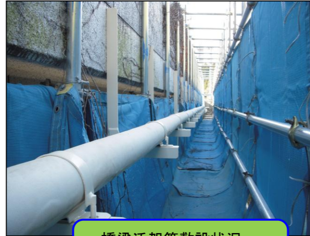
橋梁添架管敷設状況 (畑倉谷1号橋)