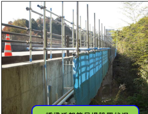
橋梁添架管足場設置状況 (畑倉谷1号橋)