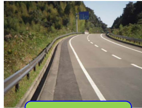
管布設後の仮復旧の状況 (県道宮崎高鍋線立体交差付近)