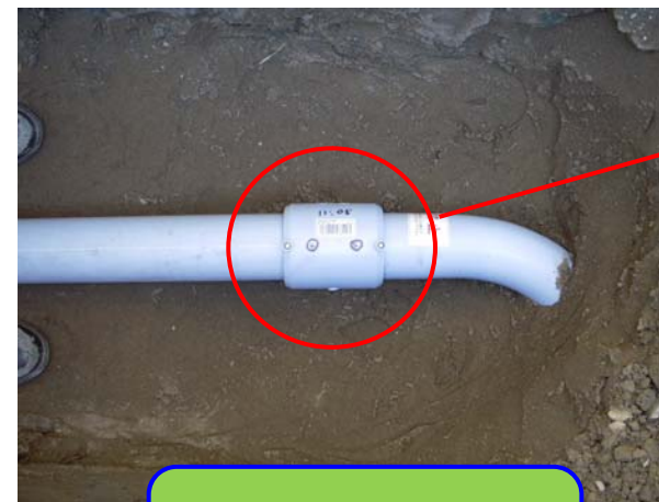
ポリエチレン管継手状況 (電気融着)