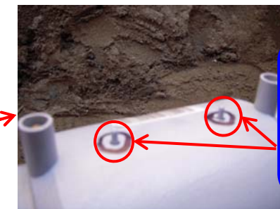
突起物が出てくれば 正常に融着(接合)さ れたこととなります。

※工事中の交通規制に御協力をお願いします。お尋ねの点がありましたら、下記までお問い合わせ下さい。 財団法人 宮崎県環境整備公社 建設課、施設運営課 TEL 0985-30-6511 FAX 0985-30-6516