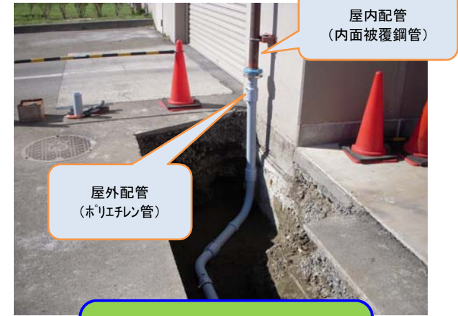
配管接続状況 (屋内配管と屋外配管接続部)